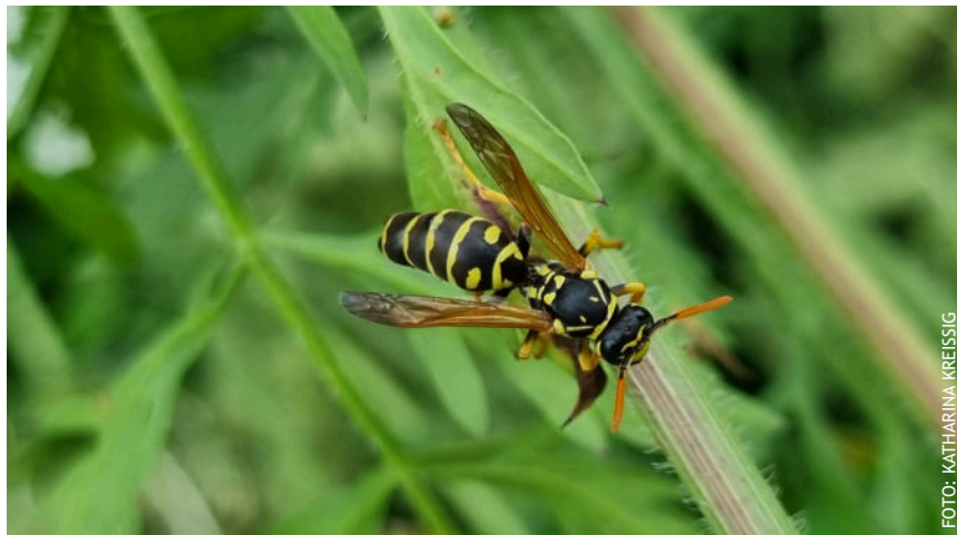
Die friedliche Haus-Feldwespe wird oft mit der Deutschen Wespe verwechselt.

Über einen besonderen Vertreter aus dem Pflanzenreich dürfen wir uns ebenfalls freuen, denn die Königskerze (Gattung Verbascum ) fühlt sich ausgesprochen wohl in unserem Pikopark. Es gibt über 300 Arten dieser imposanten Staudenpflanze, die zu den besten Pollenlieferanten gehört und entsprechenden Zuspruch durch Insekten erfährt. Es lohnt sich, die abgeblühte Pflanze stehen zu lassen, denn die Stängel werden von Wildbienen zur Fortpflanzung benutzt. Die jungen Wildbienen schlüpfen im Folgejahr. (kk)