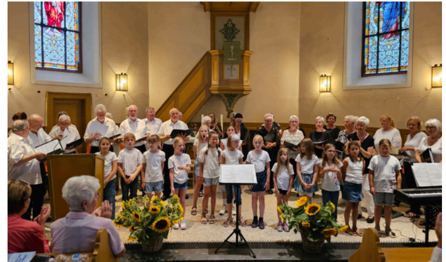
Der Projektchor der Sängereinheit und der Schulchor der Pestalozzi-Schule sorgten gemeinsam für einen stimmstarken und musikalischen Abend.