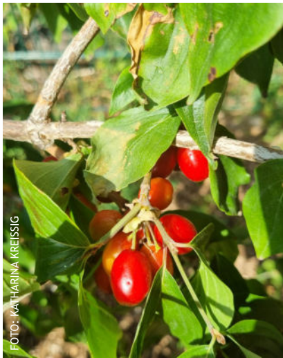
Die Kornelkirsche steht auf dem Speiseplan von 15 Vogelarten und vielen Säugetieren wie Haselmaus, Siebenschläfer und Feldhase.

Thymian, Rosmarin und Salbei. Hier wachsen verschiedene Johannisbeersorten, Himbeeren und Brombeeren, deren frühsommerliche Früchte direkt den Weg von der Hand in den Mund fanden. Besonders köstlich und außerordentlich ergiebig waren die Tomaten! Und wenn Sie jetzt die Stirn runzeln: Ja, die passen ins Konzept, denn botanisch gesehen ist die Tomate tatsächlich eine Beere. Der Naschgarten ist übrigens für alle Mitglieder unserer Kirchengemeinde da und nächstes Jahr dürfte die Ernte größer werden. Wenn Sie reife Früchte sehen – mitnachsen ist erlaubt und ausdrücklich erwünscht! (kk)