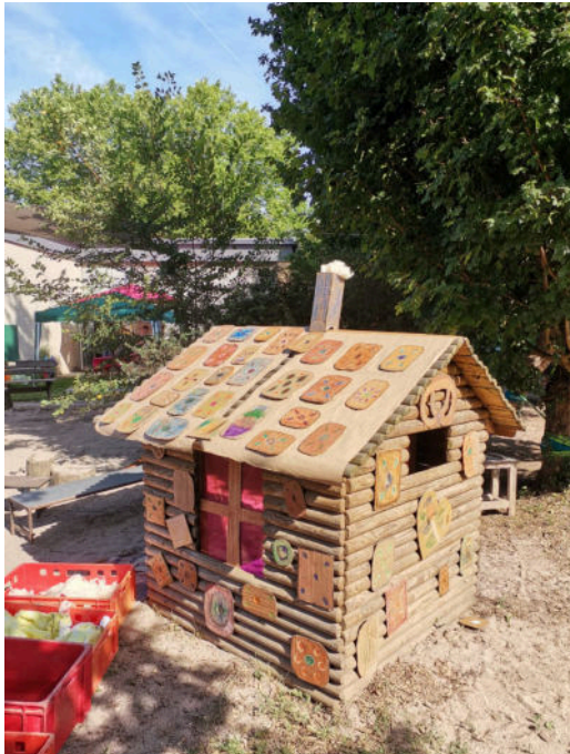
Beim Thema ‚Märchen‘ durfte natürlich auch das Hexenhaus nicht fehlen

Zusätzlich konnten die Kinder beim Kronenbasteln ihre Kreativität ausleben und sich wie echte Märchenprinzessinnen und -prinzen fühlen. Eine weitere spannende Station war das Edelsteinfinden bei "Schneewittchen und den sieben Zwergen", bei der die Kinder nach funkelnden Schätzen suchten. Das „Schlaraffenland“ lockte mit zahl-