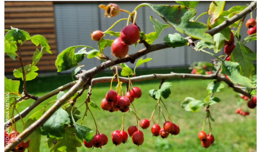
Im Sommer ist der Weißdorn eine ergiebige Insektenweide und Raupenfutterpflanze, seine Früchte sind bei Vögeln beliebt.