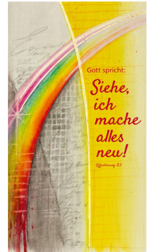
Motiv von Stefanie Bahlinger, Mössingen, www.verlagambirnbach.de

Die Offenbarung, das letzte Buch der Bibel, unser Spruch aus dem vorletzten Kapitel. Die Offenbarung, die Johannes genau so aufgeschrieben hat, wie Gott ihm alles gezeigt hat: zuverlässig und wahr. Aber die Offenbarung zu lesen, war nicht wirklich ein Genuss. Grau-