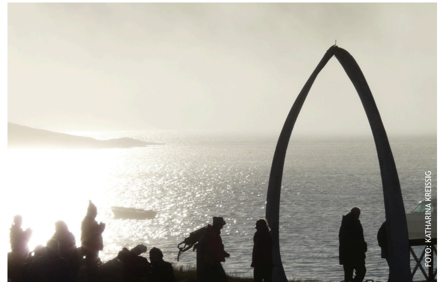
Am Hafen des ehemaligen Godhavn wird man von einem Bogenportal aus den Kiefern eines großen Wals empfangen, das an die Zeit des kommerziellen Walfangs erinnert. Heute erfreuen sich Walbeobachtungstouren in Grönland großer Beliebtheit.