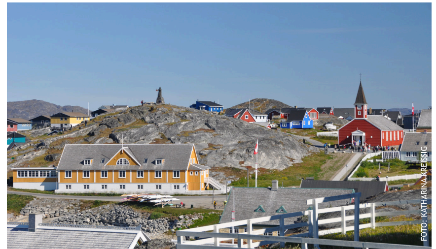
Blick auf das historische Viertel von Grönlands Hauptstadt Nuuk mit dem Denkmal für den norwegischen Missionar Hans Egede und der Erlöserkirche. Eine ihrer zwei Glocken stammt aus der Kirche einer aufgegebenen Siedlung der Herrnhuter Brüdergemeine.

Die Grönländer sind heute in religiöser Hinsicht sehr einheitlich, 98,5 % geben einen christlichen Glauben an, davon sind 95 % evangelisch-lutherisch, wenn auch nicht alle die Religion aktiv ausüben. Daneben sind die uralten Inuit-Mythen im kulturellen Bewusstsein präsent und werden von jungen Menschen wiederentdeckt. Für die Grönländer ist das kein Widerspruch. Die kleinen historischen Kirchen werden trotz der erbarmungslosen arktischen Witterung liebevoll erhalten und mit berechtigtem Stolz gerne Besuchern gezeigt. Sie sind ein Zentrum der Gemeinschaft, der Musik und des Lernens. Die Gottesdienste sind sehr gut besucht, sogar in der kalten Jahreszeit, wenn der Weg zur Kirche durch Schnee und Eis in der Polarnacht ungleich schwerer als bei uns in Deutschland ist. Johann Valentin Müller, der gerade die winterlichen Gottesdienste so sehr liebte und dem vor allem anderen immer die Menschen am wichtigsten waren, hätte das bestimmt gefallen. (kk)