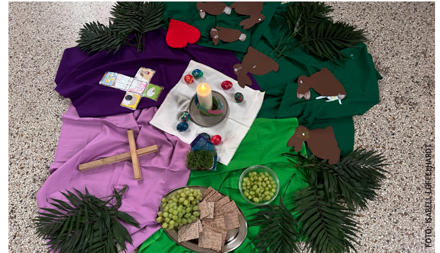
Neben dem bei Kindern bekannten Osterhasen gibt es auch andere Symbole, die im Morgenkreis eingebunden und erklärt wurden.