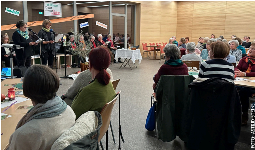
Das ökumenische Weltgebetstagsteam hatte im Gemeindesaal sowohl eine Andacht als auch im Anschluss ein Buffet mit landestypischen Speisen vorbereitet.