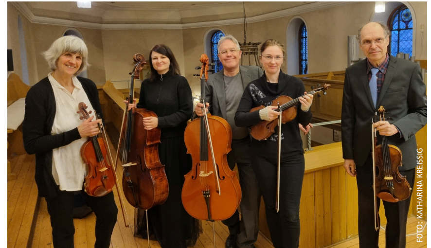
Das Ensemble Chapel Strings auf der Empore der Edinger Kirche

Zum Abschluss unserer Osterfeier und dem Osterweg sangen wir alle miteinander „Gottes Liebe ist so wunderbar“ und Pfarrer Bernd Kreissig stellte uns unter den Segen Gottes. Herr Kreissig und Herr Huy erzählten in der Kirche den Kindern den Osternweg. Mit Begeisterung hörten die Kinder der Geschichte zu. Wir als Team durften mit den Kindern eine rundum schöne Osterzeit genießen. (il)