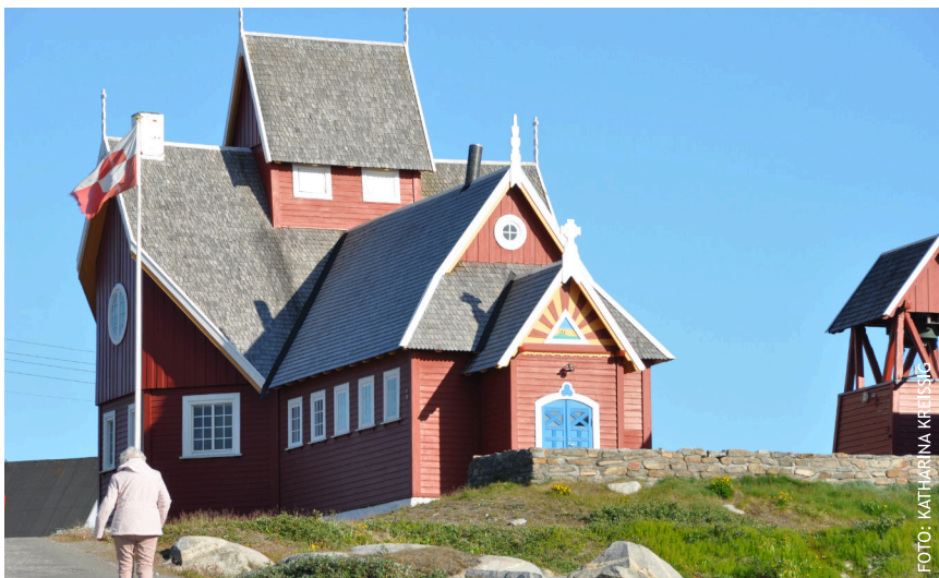
In der Stadt Qeqertarsuaq lohnt ein Besuch der historischen Kirche von 1914. Sie trägt den Spitznamen „Gottes Tintenfass“.