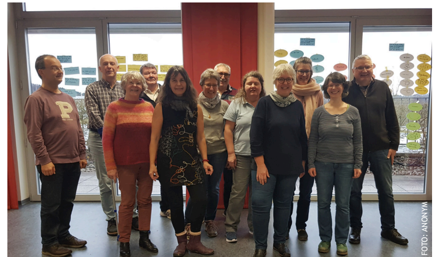
Im Dienst für die Kirchengemeinde intensiv und konzentriert arbeiten und Spaß miteinander haben schließen einander nicht aus: Die Kirchenältesten vor einem Teil ihrer Arbeitsergebnisse.