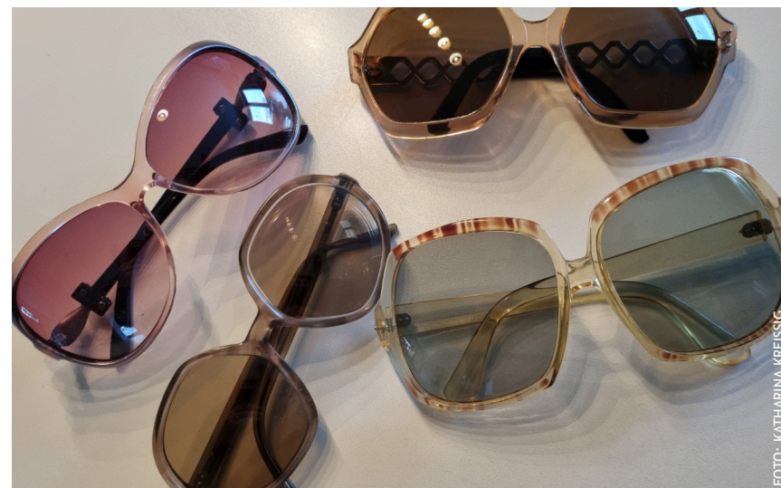
Mode aus den 60er und 70er Jahren des letzten Jahrhunderts

Alles in allem sind gut 400 Brillen gesammelt worden, ein herzliches Dankeschön an alle, die zu diesem Erfolg beigetragen haben! (kk)