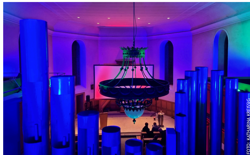
Die Edinger Kirche wurde für den Film „Das Boot“ stimmungsvoll beleuchtet. Und auch die Orgel war – zumindest atmosphärisch – „unter Wasser“