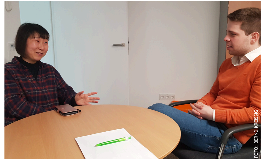
Unsere neuen Kirchenmusiker:innen im Gespräch

Abschließend noch eine Frage an Sie, liebe Gemeindemitglieder: Wie denken Sie über das Konzept des Kirchenkinos? Wir freuen uns, wenn Sie uns Ihre Ansicht zu pro und contra wissen lassen. Und wenn es Ihnen zusagt, haben Sie eine Idee für einen Film, den Sie empfehlen möchten? Welche Filme wären es, zu denen auch Sie selber gerne in die Kirche kommen würden? Zwar sind bestimmte Filme schon aufgrund der Lizenzbestimmungen für eine solche Aufführung nicht verfügbar, z.B. aktuelle Kassenschlager. Aber uns hilft es zu erfahren, über welche Filme und damit verbundene Themen Sie sich im Anschluss an eine solche Vorführung gerne mit Anderen austauschen würden. Schreiben Sie uns doch kurz! (kk)