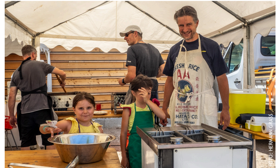
Egal ob für Helfende oder Gäste - das wird ein Fest!