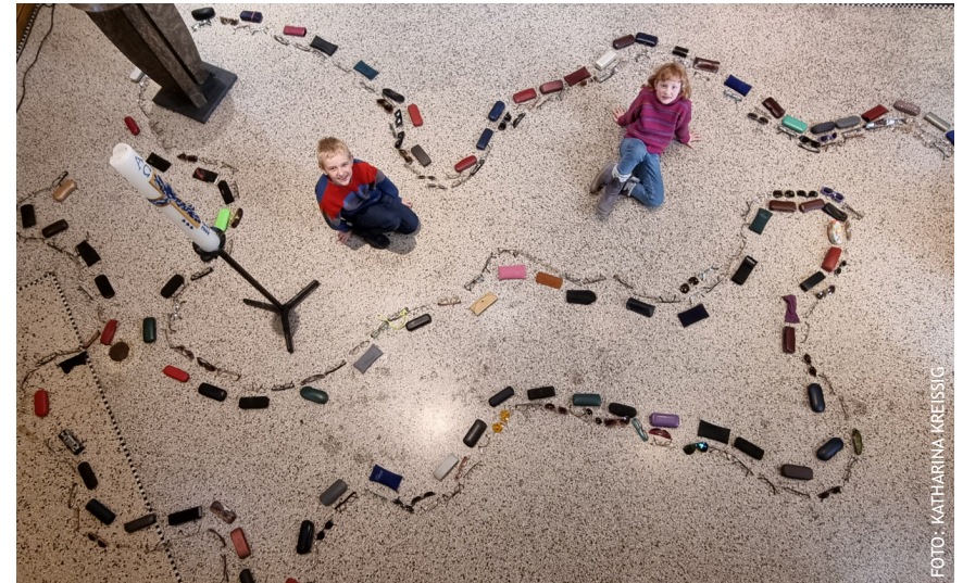
Zwei tüchtige Helfer:innen bändigen die Edinger Brillenschlange