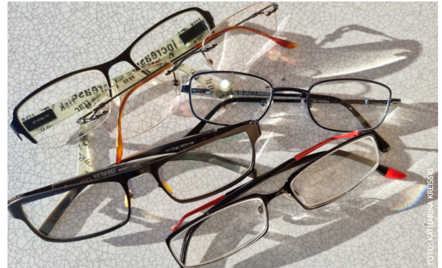
Die ersten Brillen für unsere Sammlung wurden bereits abgegeben.