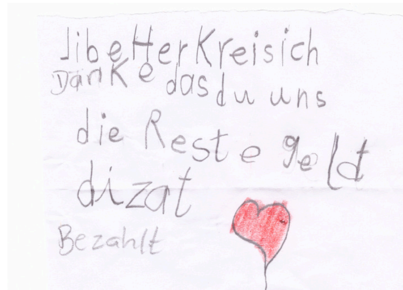
Eine ungenannte Spenderin begleitet ihre Gabe für die Bepflanzung des Kirchengartens mit diesen schönen Worten. Und ein junges Gemeindeglied bedankt sich für einen Zuschuss zum Bibel-Ferienprogramm durch die evangelische Kirchengemeinde - das letzte Wort hat ein/e Erziehungsberechtigte/r sicherheitshalber nochmal orthografisch bereinigt daruntergeschrieben.

liebe Evang. Kirchengemeinde. Dem Aufruf für eine Bäumenspende für den Kirchengarten, möchte ich gern Folge leisten, und beiliegen den Betrag von 30,-€, für einen Holmulusbusch spenden. Ein bekannter Naturkundler hat mal gesagt: Wenn man an einem Holmulusbusch vorbei geht, sollte man sich vorbeugen, und den Hut ziehen, weil er so viel Gutes für Mensch und Natur mit sich bringt. Denn soll er auch für den Kirchengarten, die Gemeinde, und überhaupt, ein Segen sein, und allem ein gutes Gelingen schenken. Eine Spenderin