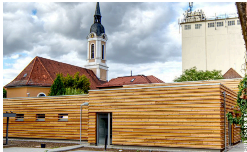
Blick von Süden auf das Ensemble aus Kirche und den angegliederten Funktionsbereichen Kirchgarten und Gemeindehaus.