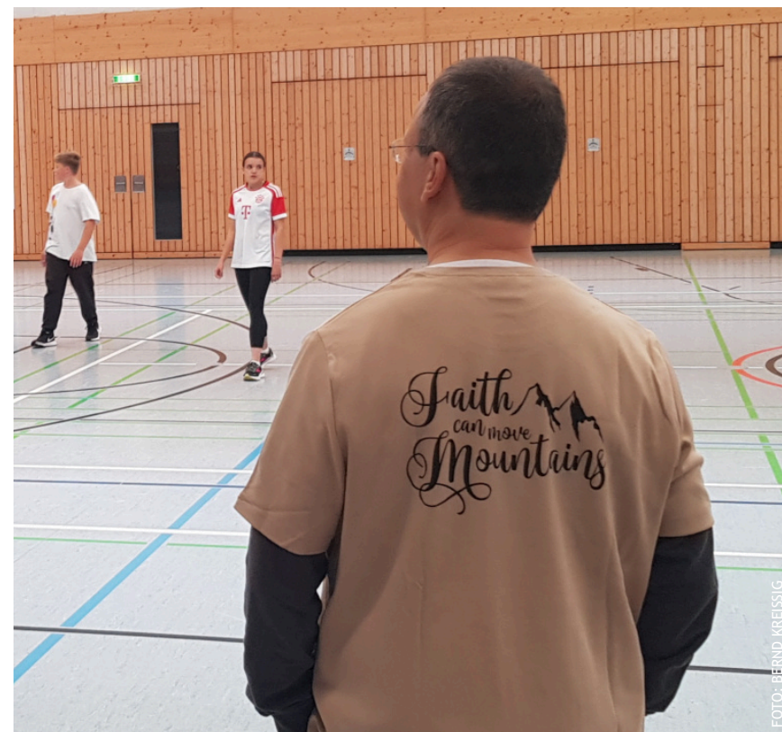
Das Motto auf den Edinger Trikots: „Faith can move mountains“ - Glaube kann Berge versetzen

Eingerahmt waren die Spiele von einer Andacht zu Beginn und einem gemeinsamen Hotdog-Essen am Ende. Besondere Komplimente von allen Seiten gab es auch für die Edinger Trikots, die uns eine Familie aus unserer Gemeinde gesponsert hatte. Ich freue mich schon auf nächstes Jahr! (bkr)