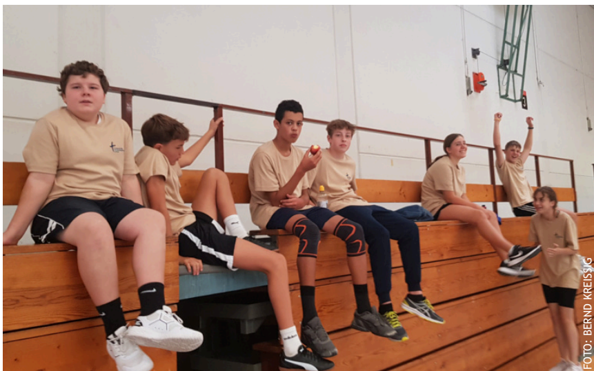
Hochmotiviert traten die Edinger Konfis beim Turnier an.