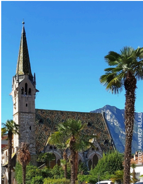
Die evangelische Trinitatiskirche in Arco

Am Fuß der Alpen in unmittelbarer Nähe des nördlichen Endes des Gardasees in der Provinz Trient liegt das Städtchen Arco. Mediterranes Flair, Palmen, Zypressen, Zitronen- und Olivenbäume, angenehmes Klima. Restaurants, Pizzerien, und natürlich Touristen zu Fuß, mit dem Fahrrad, mit dem Auto beherrschen das Straßensbild, vor allem bei schönem Wetter.