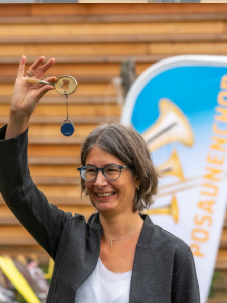
Weitere Bilder finden Sie auf unserer Internetseite unter „Bilder und Downloads“