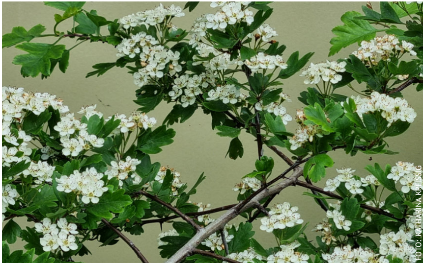
Der Weißdorn ist eine einheimische Pflanzenart.