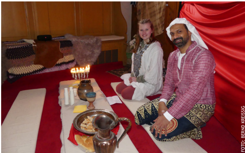
Eine Ecke der Kirche wurde zum Ort des letzten Abendmahls.