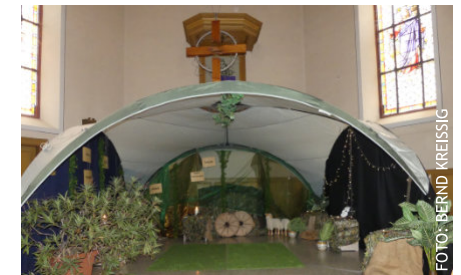
Mehr Fotos finden Sie auf unserer Webseite

tränk. Danach ging es weiter zur nächsten Station: Der gesamte Altarraum war komplett verwandelt in den Garten Gethsemane. Vom Gärtner bekam jeder einen Stein, den er nach einem Moment der Stille mitsamt einer Last – Angst, Sorge, Kummer – im Garten ablegen durfte. „Denkt immer daran, dass Gott nur ein Gebet weit entfernt ist“, gab der Gärtner dem Gast mit auf den Weg zur nächsten Szene. Auf der Orgelempore wurden die Teilnehmenden von Pontius Pilatus empfangen. Da wurde man nicht nur Zeuge der Verurteilung von Jesus, sondern richtig in den Prozess einbezogen und selbst in Frage gestellt: „Ich halte diesen hier für gerecht. Und Ihr? Habt Ihr Euch etwa noch nie schuldig gemacht? Noch nie böse Gedanken gehabt oder gelogen?“ fragte Pilatus, und gab jedem ein Schildchen mit dem Wort „schuldig“. Wir folgten dem weiß gewandeten und maskierten Jesus auf den Dachboden der Kirche zur Hinrichtungsstätte. Das Schild mit der Aufschrift „schuldig“ konnten die Teilnehmer nacheinander am Kreuz ablegen