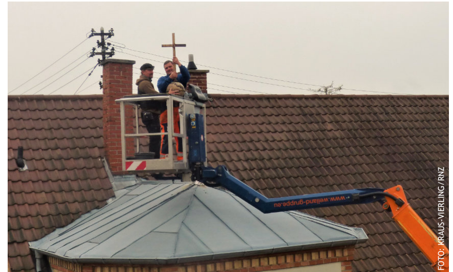
Am 11. Mai wurde unser altes Kreuz vom ehemaligen Gemeindehaus in der Anna-Bender-Straße abgenommen. Derzeit wird geprüft, wie es so restauriert werden kann, dass es auf dem neuen Gemeindehaus angebracht werden kann.