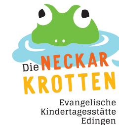
Auch noch ziemlich neu: Die Logos unserer vier Kindertagesstätten