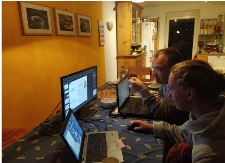
Zusammen am Gemeindeboten arbeiten macht Spaß und am Tisch wäre noch Platz für einige Mitstreiter*innen.